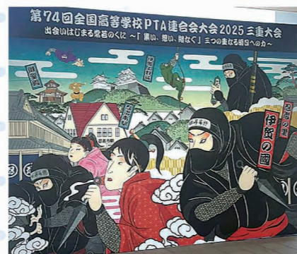
2025三重大会大会の看板