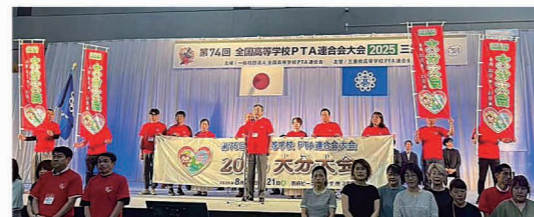
次回開催県(大分) 引継ぎ式の様子