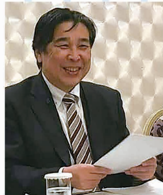
第75回 全国高等学校PTA連合会大会 2026大分大会 実行委員長